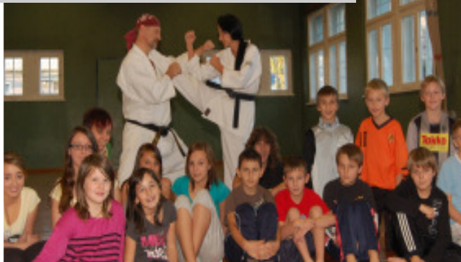
Aktiver J-Room - eine der Aktionen: Selbstverteidigungs-Schnupperkurs