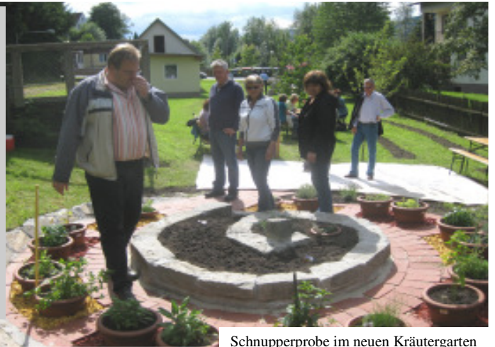
Schnupperprobe im neuen Kräutergarten