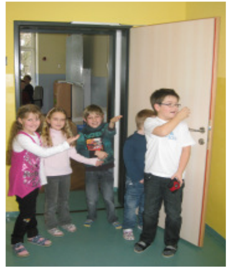
Verbesserter Brandschutz in der Volksschule durch Brandschutztüren