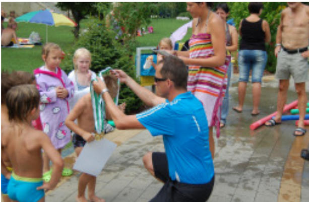
Kindersommer: Medaillen für die Schwimmkurseilnehmer