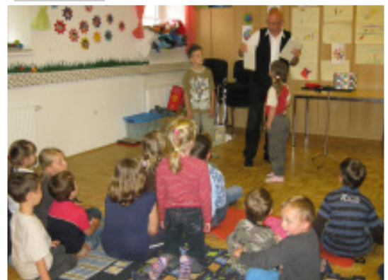
Interessierte Zuschauer im Knirpsraum