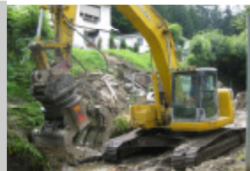
Starke Unwetter im Juni 2010 erfordern umfangreiche Sanierungen