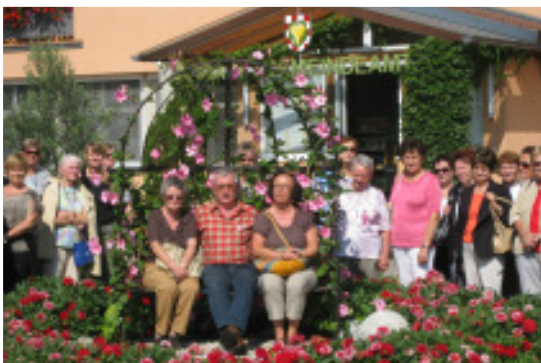
Die Preisträger des Blumenschmuckbewerbes in Gamlitz