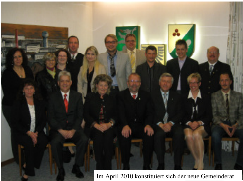
Im April 2010 konstituiert sich der neue Gemeinderat